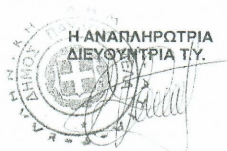
ΠΑΠΑΔΙΑΜΑΝΤΗ ΑΣΗΜΙΝΑ Αρχιτέκτων Μηχανικός